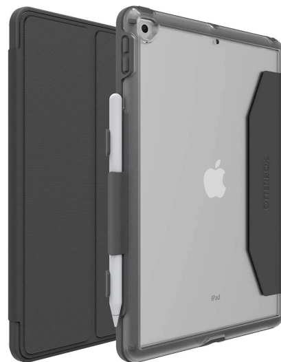
Apple Pencil NO incluido